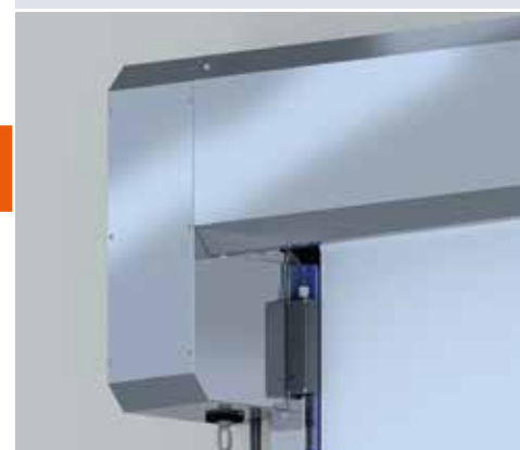
Safety Linear Encoder